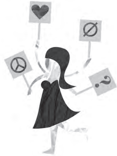
Cuisine des mots /p. 63