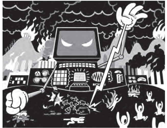
Mon ami le diable / p. 54