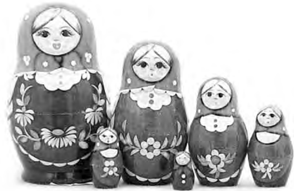
“Sœur Catherine, viens au lit!” /p. 36