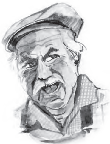
Un conteur forestier /p.78

67 cuisine des mots conception Chantal Grimm illustrations Théo Desimpel