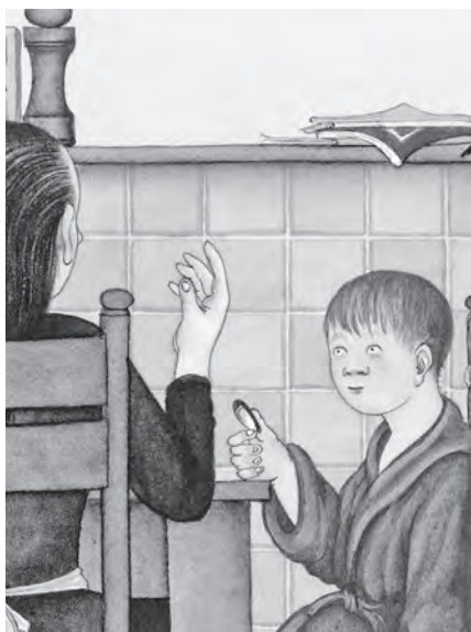
Coups de cœur /p. 94