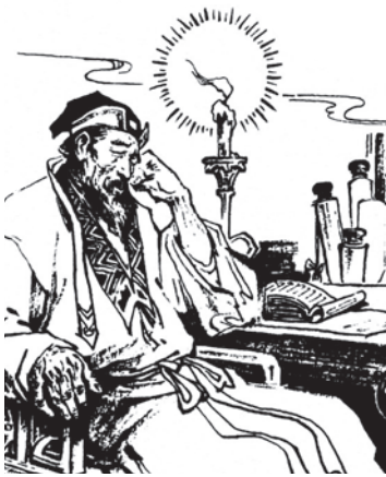
À l'époque de Pu Songling /p.78

71 cuisine des mots conception Chantal Grimm illustrations Marie Leghima