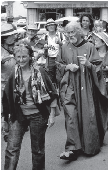
Une Québécoise en Bretagne /p.84